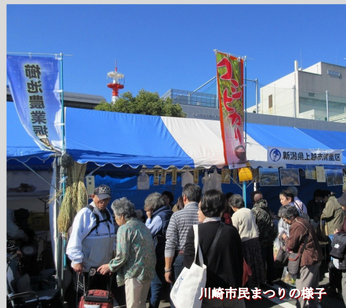
川崎市民まつりの様子