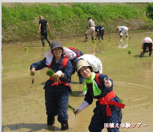
田植え体験ツアー