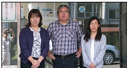
櫛池農業振興会の職員

雪が降ったらどうしよう…、具合が悪くなったらどうしよう…、人間関係でトラブル発生…等々、困った時は地域の皆さんで優しくサポートしますので、気軽に話しかけてください！