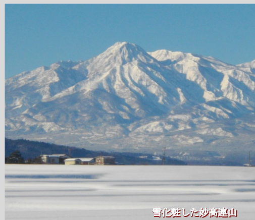
雪化粧した妙高連山