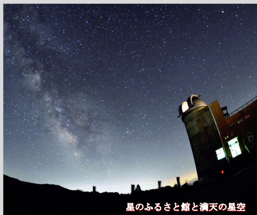
星のふるさと館と満天の星空