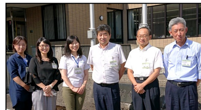
清里区総合事務所はじめ市職員