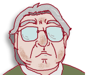
檜池農業振興会 平田事務局長からひとこと

檜池地区は高齢者が多い地域ですので、除雪体制の整備・実用化、高齢者の通院・買い物の移手段の確保などが急務となっています。任期中は檜池農業振興会に席を置きながら活動していただきます。私を含め3人の職員が業務から日常生活までサポートしますし、営農組織や地域の方も良くしてくださいませので、安心していらしてくださいね。