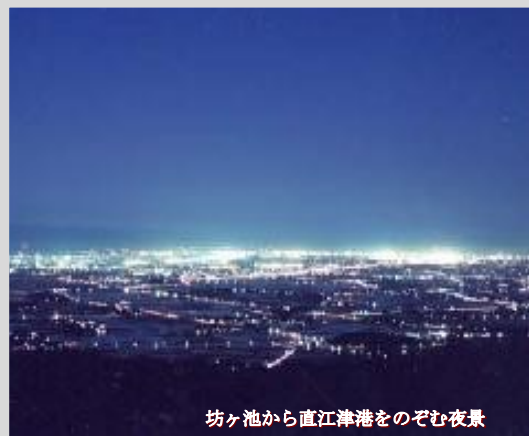
坊ヶ池から直江津港をのぞむ夜景