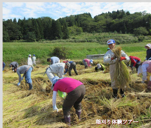
稲刈り体験ツアー